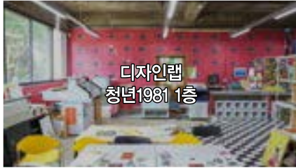
디자인랩 청년1981 1층

“다양한 아이디어와 창작이 공존하는 상상실험실에서 여러분의 상상을 펼쳐보세요!”