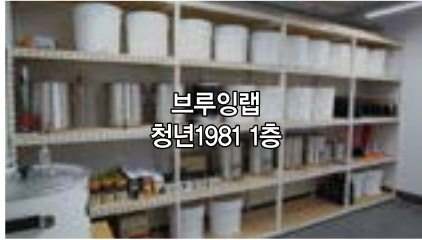
브루잉랩 청년1981 1층