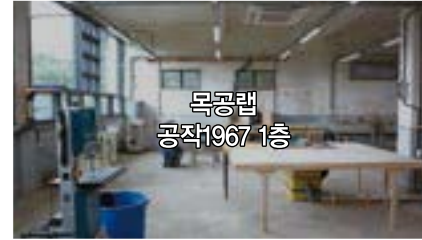
목공랩 공작1967 1층